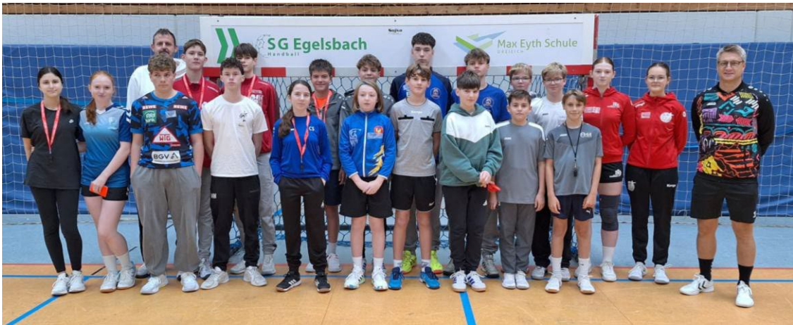
Teilnehmende in Egelsbach