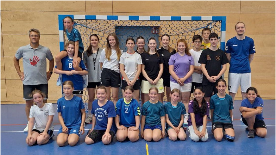
Teilnehmende in Arheilgen