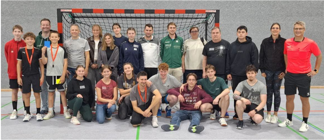
Teilnehmende in Lorsch