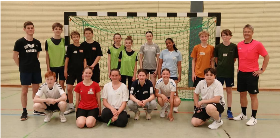
Teilnehmende in Seeheim.